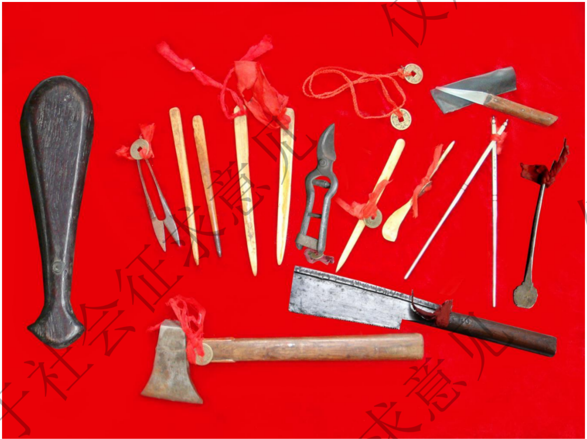
图 7：长白山放山习俗所用工具