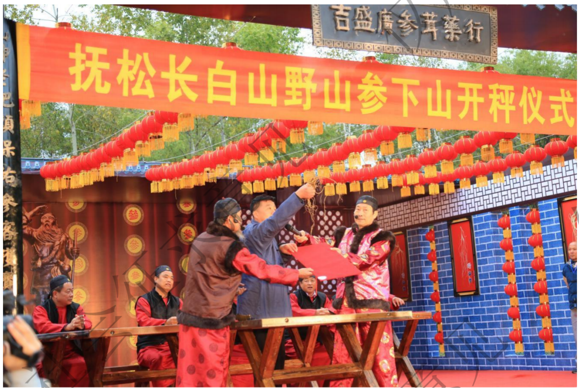
图 5: 抚松长白山野山参下山开秤仪式