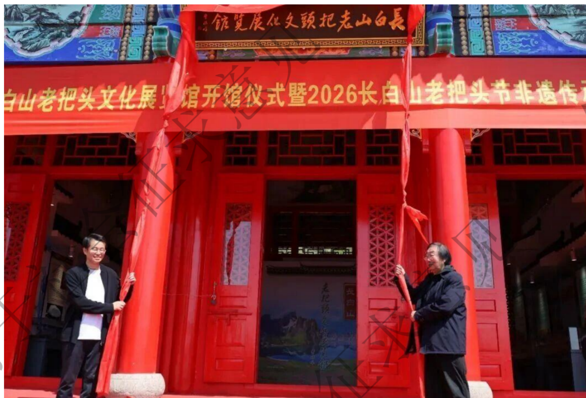
图 1: 长白山老把头节文化展览馆开馆仪式暨 2026 长白山老把头节非遗传承活动现场