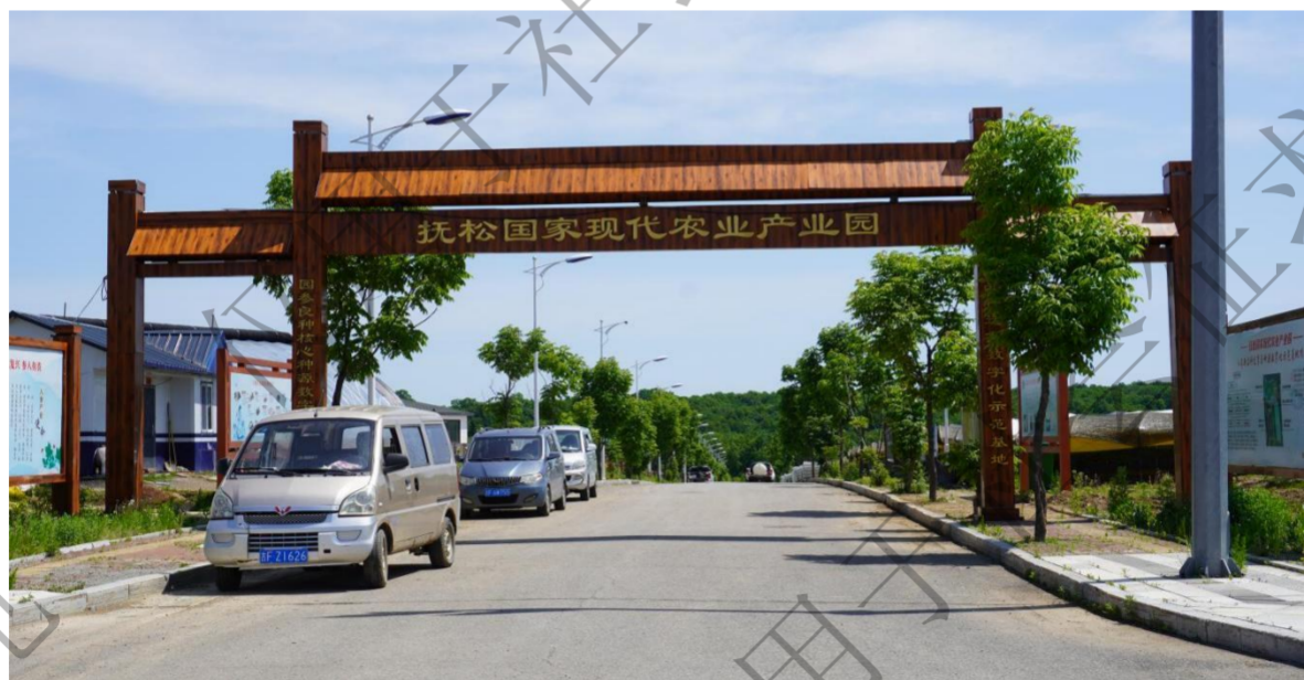
图 2: 小山村附近“大马牙”人参品系资源及栽培记忆核心保护基地