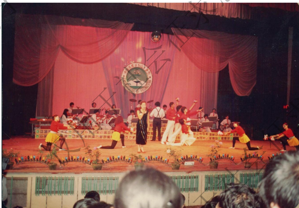
图4：第一届人参节晚会现场（1987年）