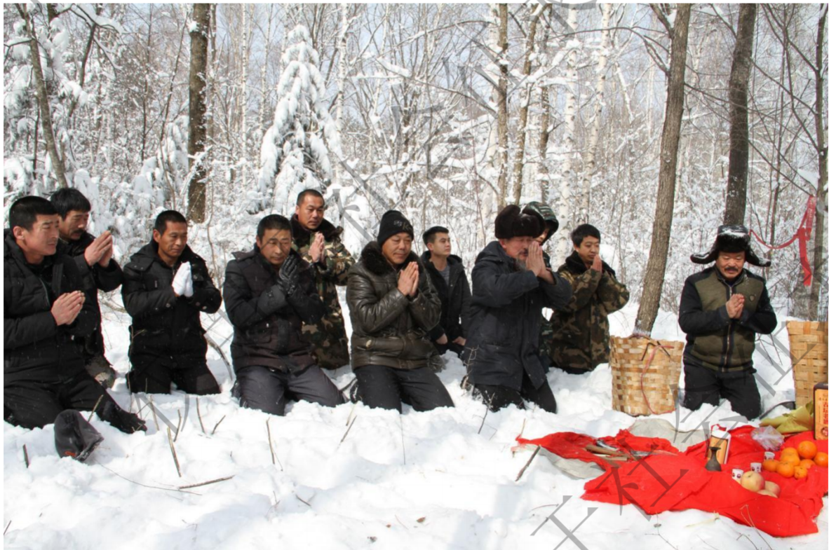
图 6: 进山前祭拜老把头