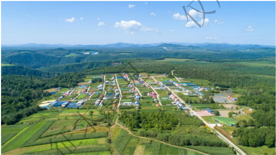
图 9：东岗镇西江村鸟瞰图