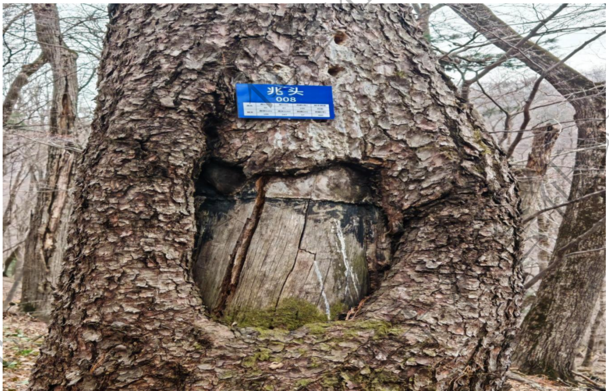
图 8：楞场村附近已挂牌的兆头古树