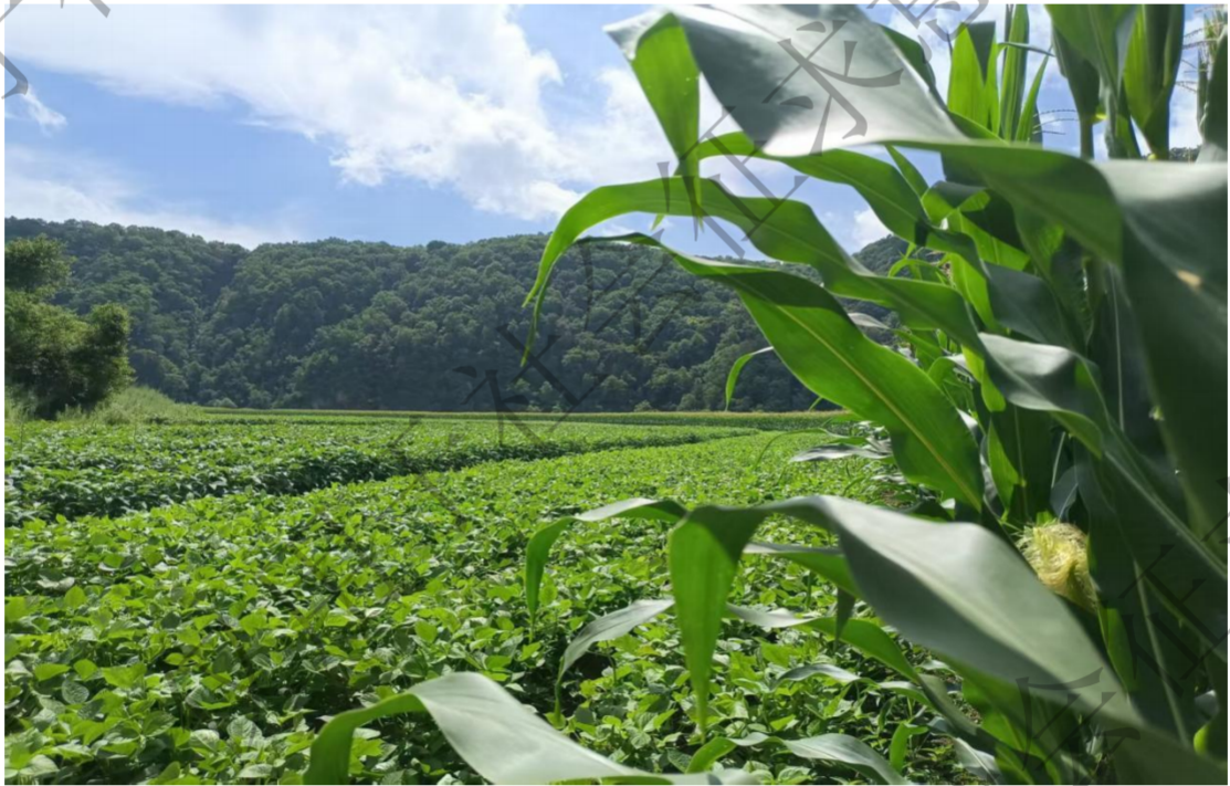
图 10：西江村老参地遗址